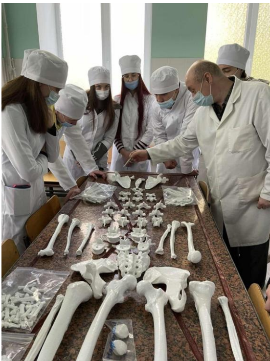
Рисунок 2. Використання надрукованих на 3d-принтерах синтетичних моделей кісток скелету людини під час освітнього процесу на кафедрі анатомії ХНМУ

Розробивши нову методику ми змогли відтворити тривимірні моделі мозку, селезінки, печінки, кишківника та інших внутрішніх органів, які на 100% відсотків відповідали і за структурою, і за текстурою оригінальним анатомічним препаратам.